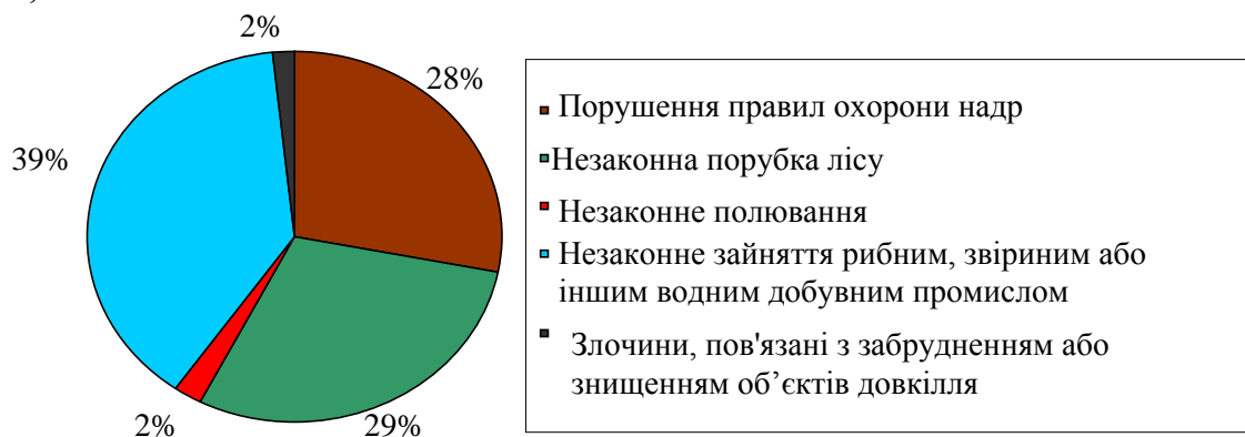
Рис. 2. Структура судимості за злочини проти довкілля у 2007 році (за даними Державної судової адміністрації України)

Аналіз правозастосовної практики дозволяє виявити чітку тенденцію, що була притаманна діяльності правоохоронних органів ще в радянські часи [1, с. 267]: застосовуються норми про відповідальність за злочини, пов’язані з незаконним заволодінням природними ресурсами. Як видно з наведеної діаграми, доля засуджених осіб за злочини, пов’язані із забрудненням або знищенням окремих об’єктів довкілля (забруднення або псування земель, порушення правил охорони вод, знищення або пошкодження лісових масивів, умисне знищення або пошкодження територій, взятих під охорону держави, та об’єктів природно-заповідного фонду, безгосподарське використання земель) становить 1,6 %.