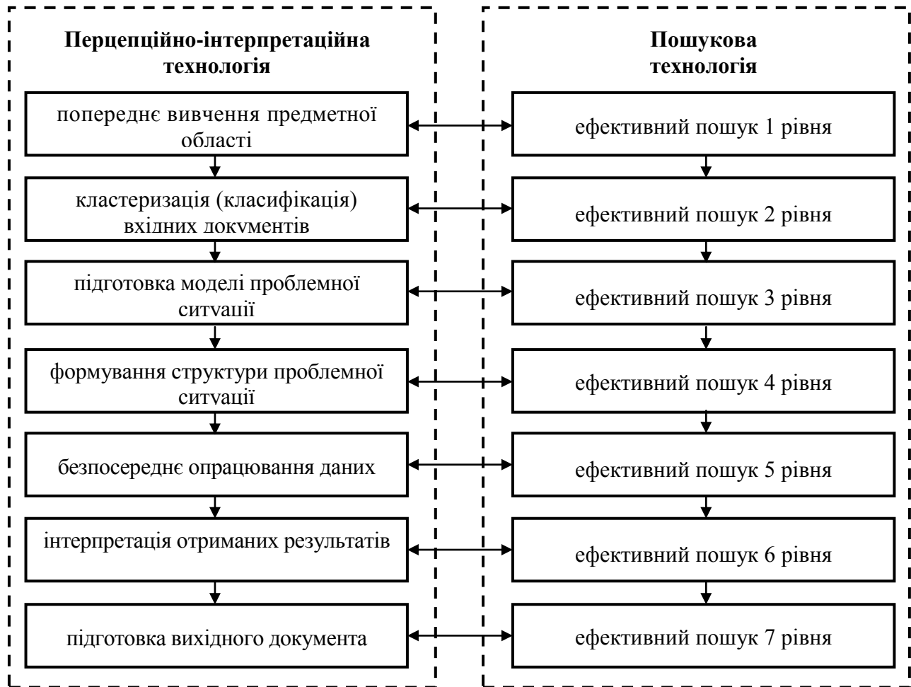
Рис. 1. Узагальнена схема організації перцепційно-інтерпретаційної методології

В такому випадку можна виділити два об’єкта (можливо, гіпотетичних) – абсолютно найкращий і абсолютно найгірший, яким всі експерти дали відповідно самі кращі і самі гірші оцінки по всім критеріям. Необхідно упорядкувати (відсортувати) об’єкти від кращого до гіршого, виходячи з багатокритеріальних оцінок об’єктів [8].